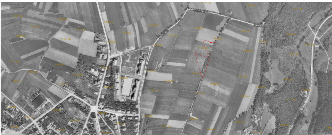
1946 letecký snímek